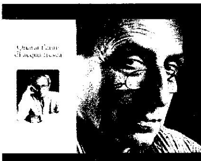
Quarant'anni di acqua fresca Una vita nell'omeopatia

di Osvaldo Sponzilli, edizioni Studio Tesi, pagine 231, euro 14,50